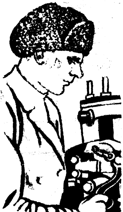
Тов. ЗОЛОТУХИН, слесарь затона, работающий на ремонте машинных частей. Все время переливает свои задания.

Как ископаемые чудовища торчат из-под снега—прорези, плашкоуты, катера. Всех их до 80