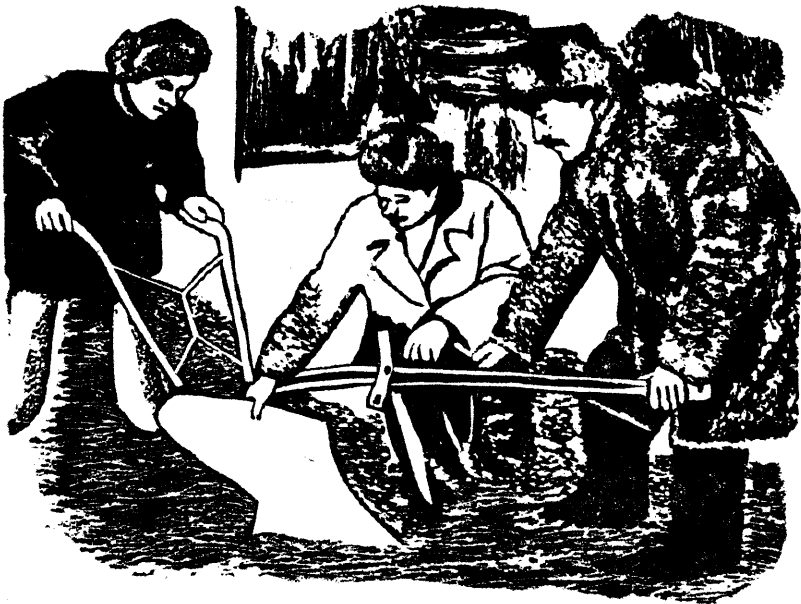
На снимке Самаровский колхоз за повторной вспашкой паров