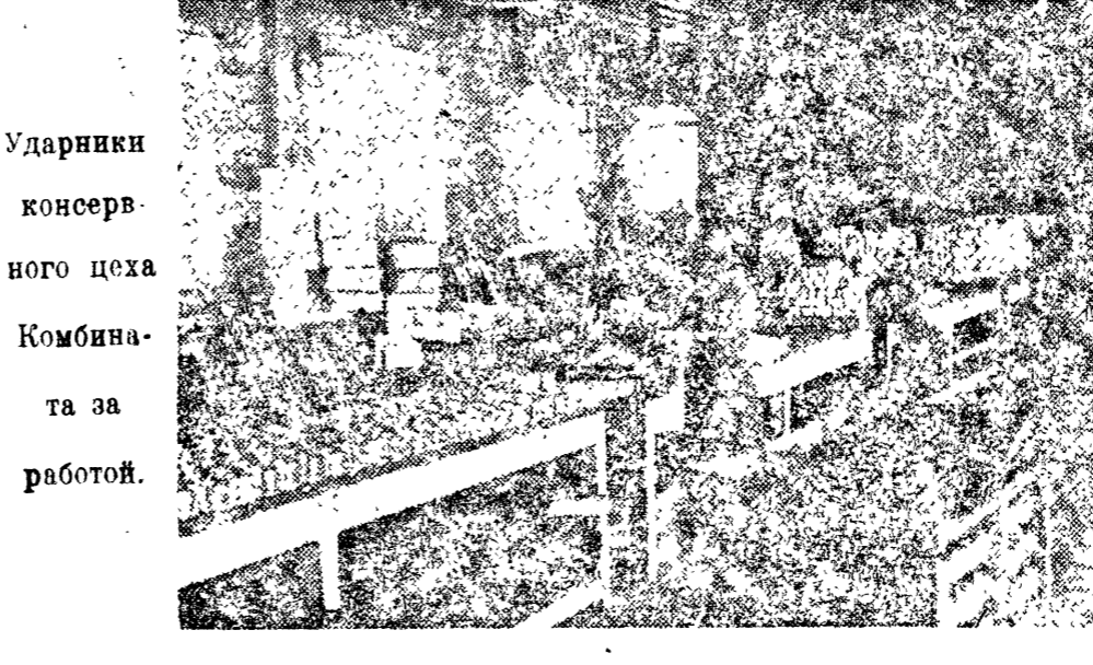
Ударники консервного цеха Комбината за работой.