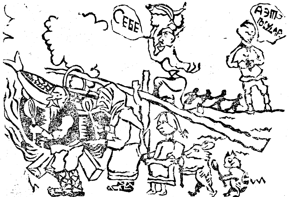
„Попадает только на котел“.