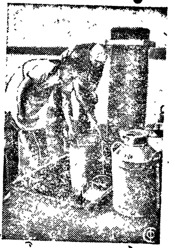
Лучше уход—больше молока. НА СНИМКЕ: Отправка молока на маслозавод.

КОЛХОЗЫ. УЛУЧШАЙТЕ УХОД ЗА МОЛОЧНЫМ СКОТОМ