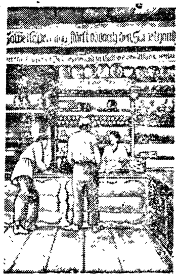
НА СНИМКЕ: кооперация в немецком поселке Куккус (республика немцев Поволжья)

Вот плоды фашистского правления в Германии. Недовольство крестьянства нарастает. В ряде мест вспыхивают волнения. Крестьяне недопускают продажи их хозяйства.