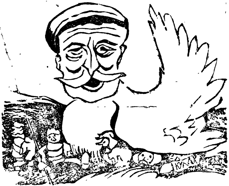
Под крылышком у Башмакова

Поэтому вокруг советов и в особенности в связи с отчетно-довыборной кампанией, кулаки и шаманы ведут настойчивую работу за свое влияние, за свои кандидатуры.