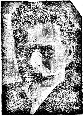
М. И. Калинин.

Полномочным представителем СССР в Соединенных Штатах Америки назначен президиумом ЦИК СССР тов. Трояновский Александр Антонович.