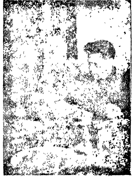
Дать трудящимся дешевые доброкачественные обеды. На снимке: в столовой, в Самарове.

На ряду с всемерным вовлечением массы колхозников на советские базары, повести решительную борьбу со спекулянтским перекупщицким, в то же время разъясняя сущность разговоров о том, что советско-колхозная торговля для того, чтобы иметь торгующих для обложения их налогом, Райкомы, ячейки ВКП(б) кооперативные организации не дол-