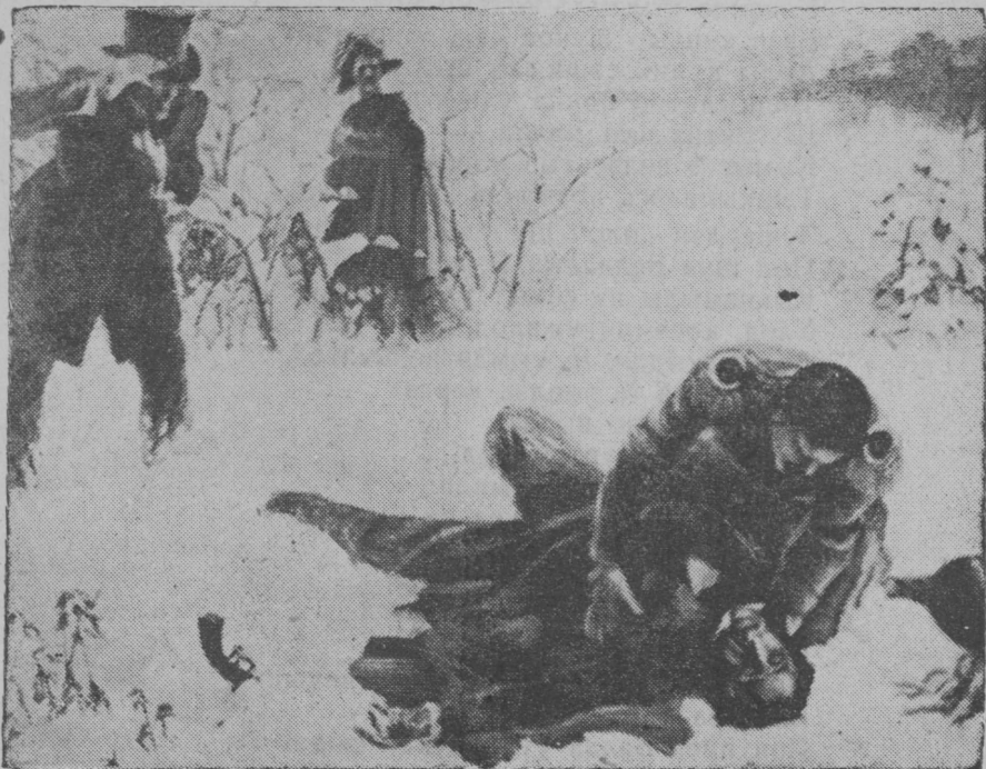
А. С.Пушкинлэн Дантесэн ваче ыбылйс ьконын (дуэлын) сёсырмемез

Орчиз сю ар. Пазьгемын со кыршам Россилэн - калык ютрмалэн бервылыз. Советской Союзысь эрике потэм калык Пушкинэз, быдзым поэтэз, выль зуч литературалэсь родо-начальниксэ. Зуч литературалы кыл кылдытйсьез миллионёс'ын дан'яло. Пушкин зуч литературалы гинэ өвёл—вань братской калык'ёслы но ноку вунонтэм, революционной мылкыдэз бугыртйсь, быдэс человечестволэн шудэз понна нюр'яськонэ өтись произведениос сётйз. Пушкин асьмелы гениальной поэтической кужыменыз дуно. Солэн произведениосыз'я дышетскыса даур'ёс чоже пөртэм нациосысь трос поэт'ёс калык шудэз кужмо, жингыртйсь куараен кырзаны дышозы.