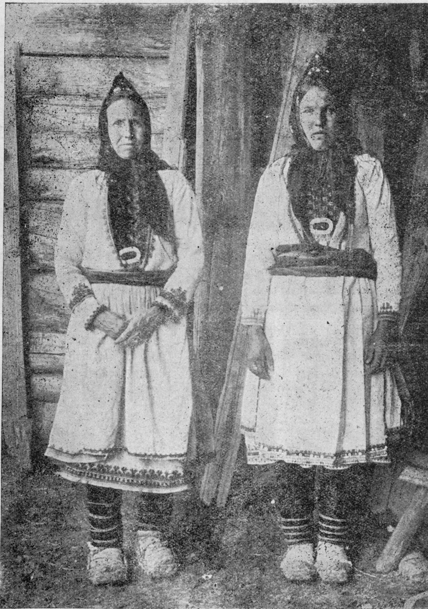
Шэрнур кантон ватэ-влак.

Кэчэ куэ вуйым чэвэртэн шинчэш. Кас йуалгэ йуж куэр йўмач лэжын пэлэдышын ўпшэн йыр шарла. Йыр-ваш тымык, мардэж йужат укэ. Йалыштэ гына йужо вэрэ муру йўк шокта, адак энэр воктэн купышто шўшпыкат ышкэ кас мурьжым талын тарватэн. Рўп лиймэш модшо ўдыр-качэ-шамыч ты манмэш „выж-вуж“ шалавэн, мўнгышт кайэн пытышт.