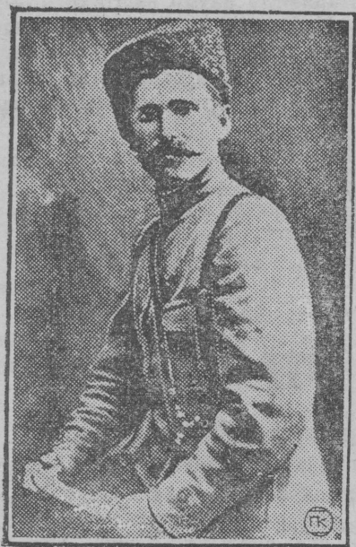
Ч а п а й э в.

та мийэн шуат гын, тудо савырнэнат ок шукто... Кок сагат гыч чылан лэкташ күлэш. Ўжара коймо дэч ончыч Порт - Артур*) дэнэ лийаш күлэш. Пычкэмыштэ, волгыдо дэч ончыч... Ынлышда?..