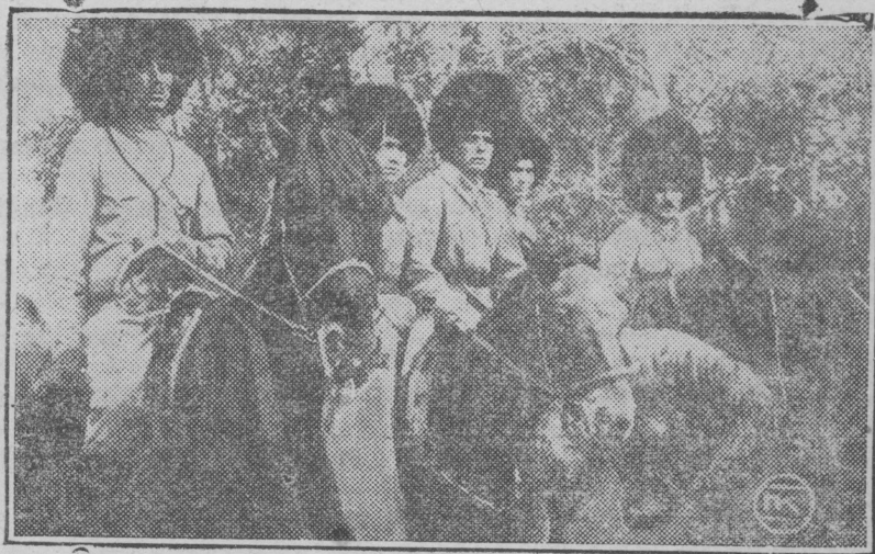
...Имньэ ўмбақышт шинчын кайаш тарванышт...