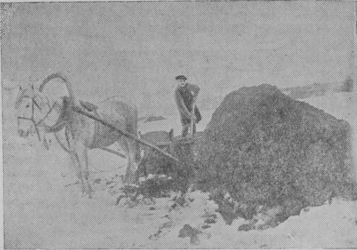
Колхоза «12-й Октябрь», Руамешкан кўласовияттуу, велав туахта муааблоккалар варойн. СНИМКАЛЛА: колхозничка П. И. Богомазов велав пелдох туахта. Куликван Фото.