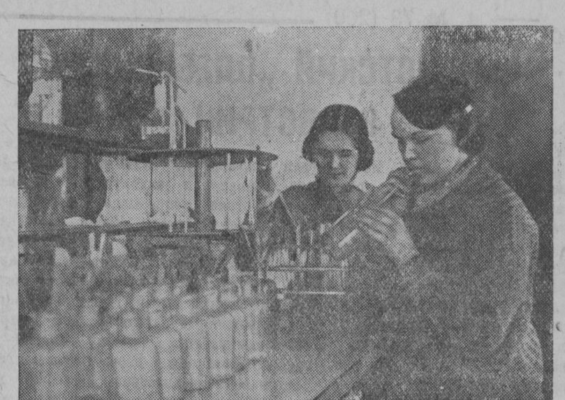
В Рамешковской МТС в конце прошлого года создана агрохимическая лаборатория. В нее поступило на анализ больше 300 образчиков почвы. 280 из них, для 88 колхозов, уже проанализированы. Произведен также анализ почвы 20 мяловских участков района.