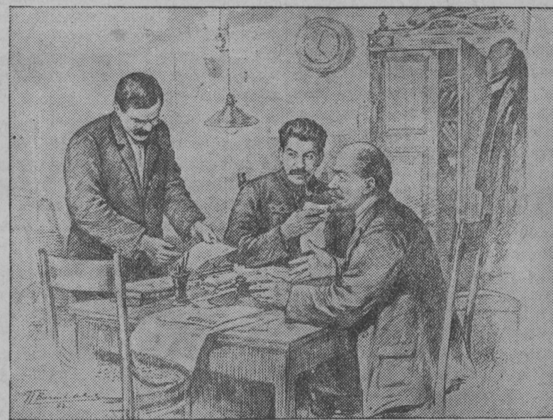
НА СНИМКЕ: В. И. Ленин, И. В. Сталин и В. М. Молотов в редакции газеты „Правда“ в 1917 году (Центральный музей В. И. Ленина).

„Печать — единственное орудие, при помощи которого партия ежедневно, ежечасно говорит с рабочим классом на своем, нужном ей языке“. (СТАЛИН).