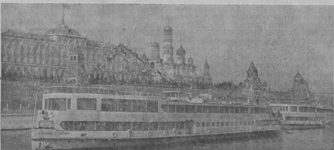
Волжская флотилия у стен Кремля.

пчеловод колхоза им. Чапаева Б. Псковского сельсовета. Лихославль.