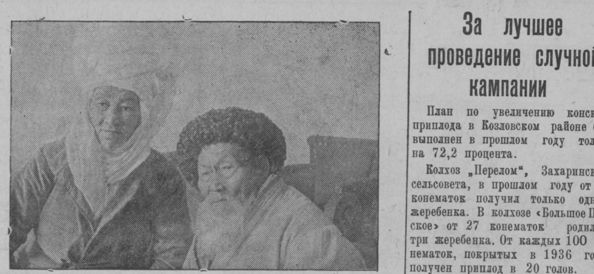
20-мая исполняется 75-летие поэтической деятельности народного певца Казахстана орденосца Джамбула...