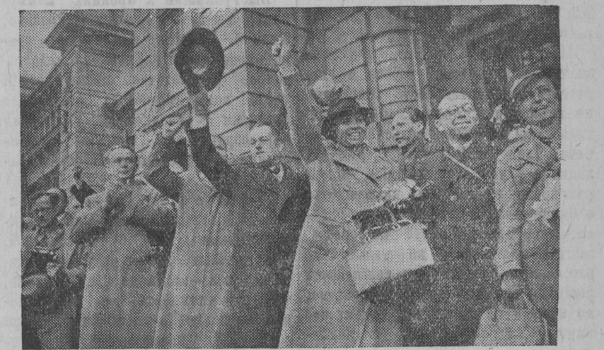
НА СНИМКЕ: представители французской и чехословацкой делегаций на Белорусско-Балтийском вокзале, СОЮЗФОТО.