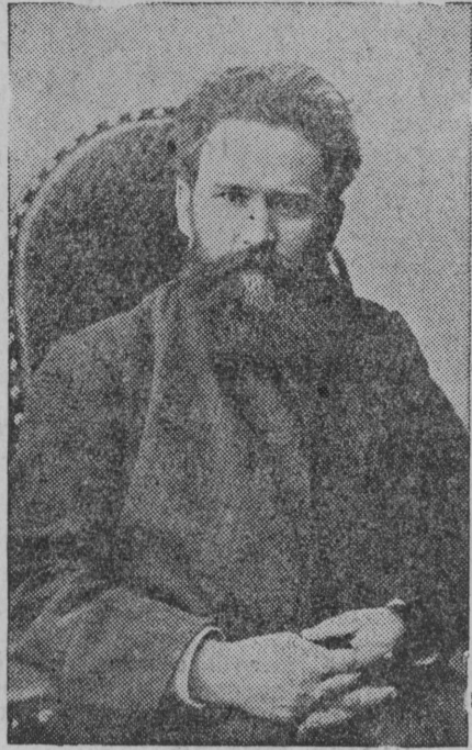
27 июня исполняется 85 лет со дня рождения замечательного писателя Владимира Галактионовича Короленко. НА СНИМКЕ: Владимир Галактионович Короленко.

На других фронтах положение без перемен.