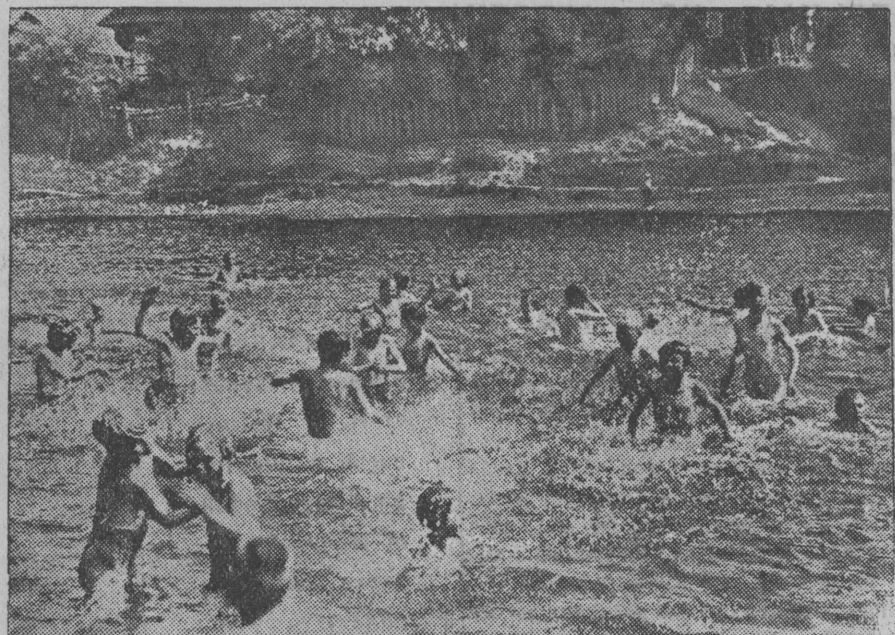
Весело проводят время пионеры в лагере Новокарьельского района. НА СНИМКЕ: ребята купаются в реке Медведице.

По инициативе Сталинского Наркома Водного Транспорта тов. Ежова для пассажиров Канала Москва—Волга создаются все новые и новые удобства. Открываются новые линии, улучшается обслуживание пассажиров на пристанях, в портах и на судах. (ТАСС).