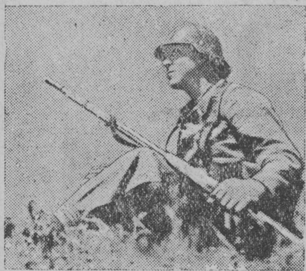
В РЕСПУБЛИКАНСКОЙ ИСПАНИИ. На снимке: боец республиканской армии.

В районе Москеруэла отряд республиканцев совершил вылазку вглубь территории мятежников и взорвал помещение штаба бригады мятежников. Весь состав штаба убит. (ТАСС).