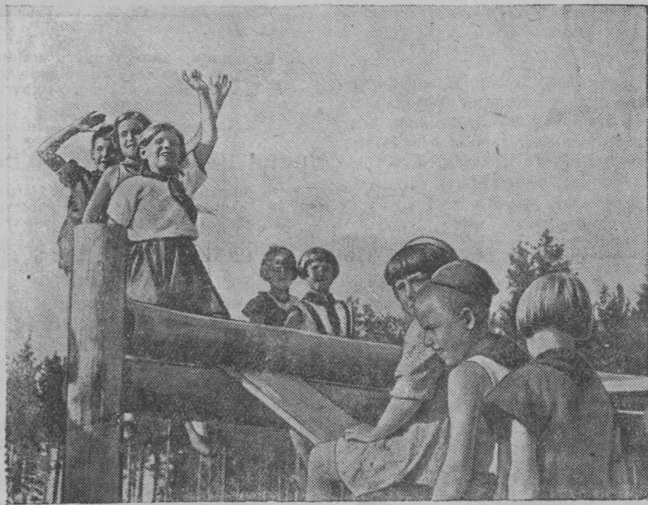
Пионерский лагерь фабрики имени Володарского (г. Калинин). В часы досуга ребята качаются на качелях.