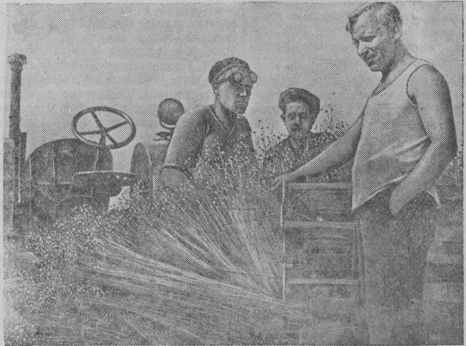
Депутат Верховного Совета СССР, зам. председателя Калининского облисполкома В. Ф. МОЛЯКОВ беседует с льнотерельщиками.

Минеральные удобрения при общей плод заправке навозом и торфом должны ити широкое применение на парах. Преимущественное применение должны иметь фосфоритная мука и сальвинит. В случаях неполной нормы навоза (15—18 тонн на гектар) с применением 6—8 центнеров фосфоритной муки и сальвинита, при отсутствии в парах навоза или торфа следует на эту площадь внести фосфорной