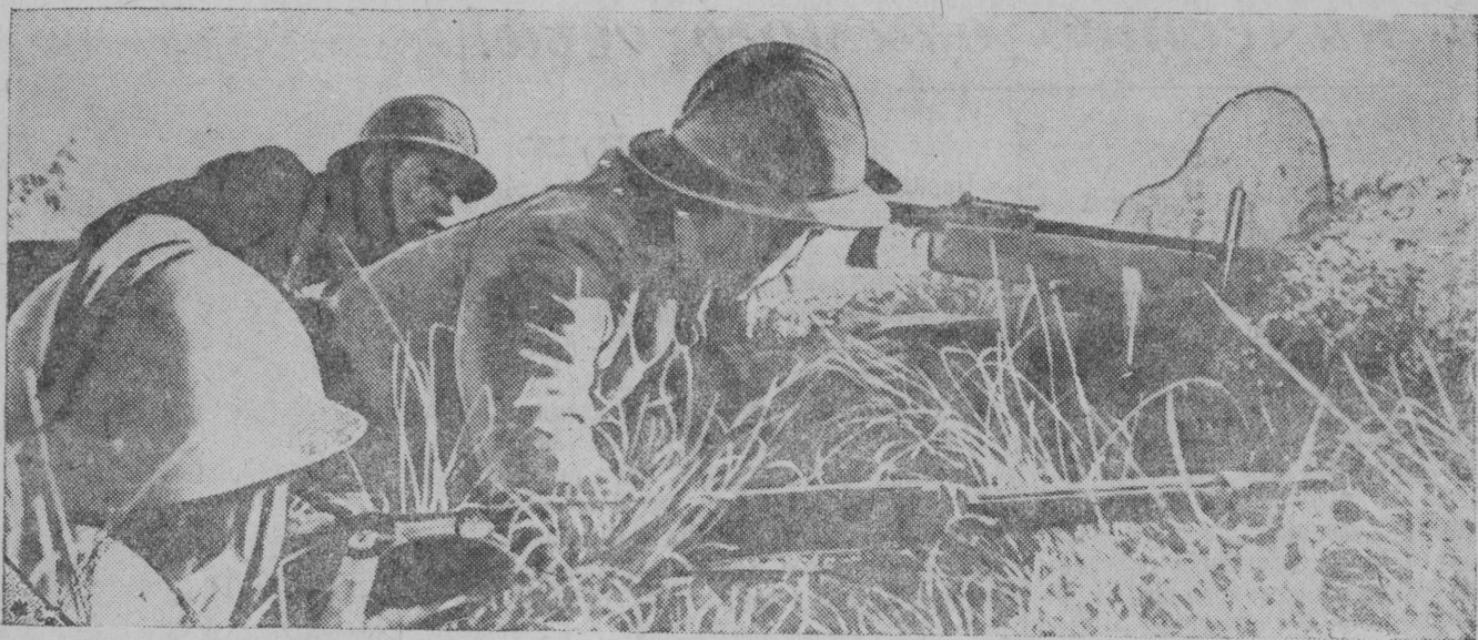
В республиканской Испании. НА СНИМКЕ: пулеметчики республиканской армии на передовых позициях в зоне реки Эбро.

На их оборудование затрачено более 6 тысяч рублей.