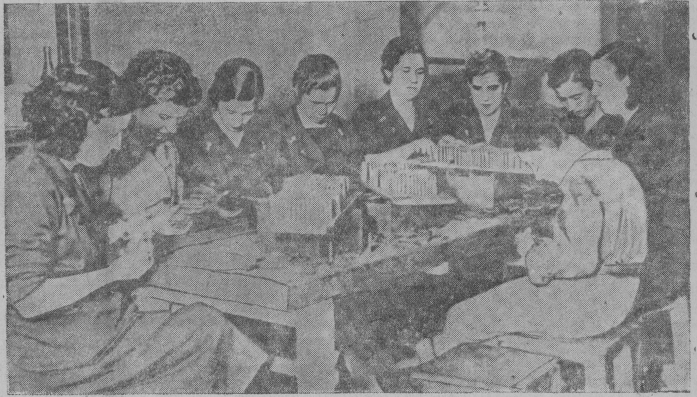
С большим энтузиазмом работают женщины республиканской Испании в оборонной промышленности страны. НА СНИМКЕ: женщины за работой в одном из цехов патронного завода в окрестностях Валенсии.