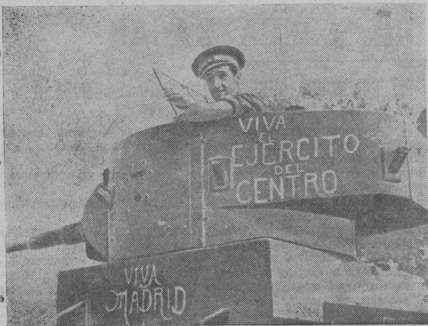
В республиканской Испании. НА СНИМКЕ: танкист республиканской армии. На танке надпись: «Да здравствует армия Центрального фронта». «Да здравствует Мадрид». СОЮЗФРОНТ.