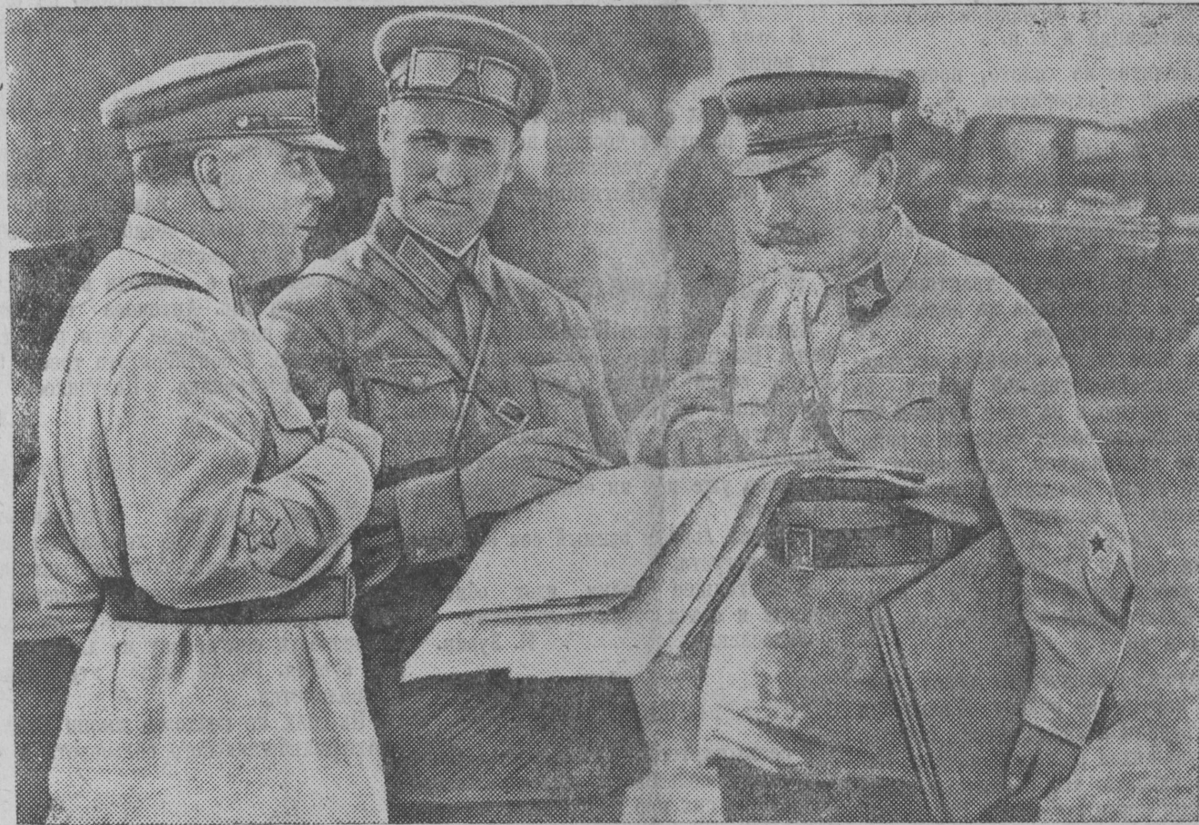
На осенних тактических учениях частей Московского военного округа. НА СНИМКЕ: (слева направо) Народный комиссар обороны маршал Советского Союза К. Е. Ворошилов, командир Соколовский и командующий войсками Московского военного округа маршал Советского Союза С. М. Буденный рассматривают карту учений частей МВО.

Пора завершить уборку урожая во всех без исключения колхозах. Одновременно с этим необходимо ускорить выполнение плана зернопоставок, закончить озимый сев и широко развернуть кампанию заботы.