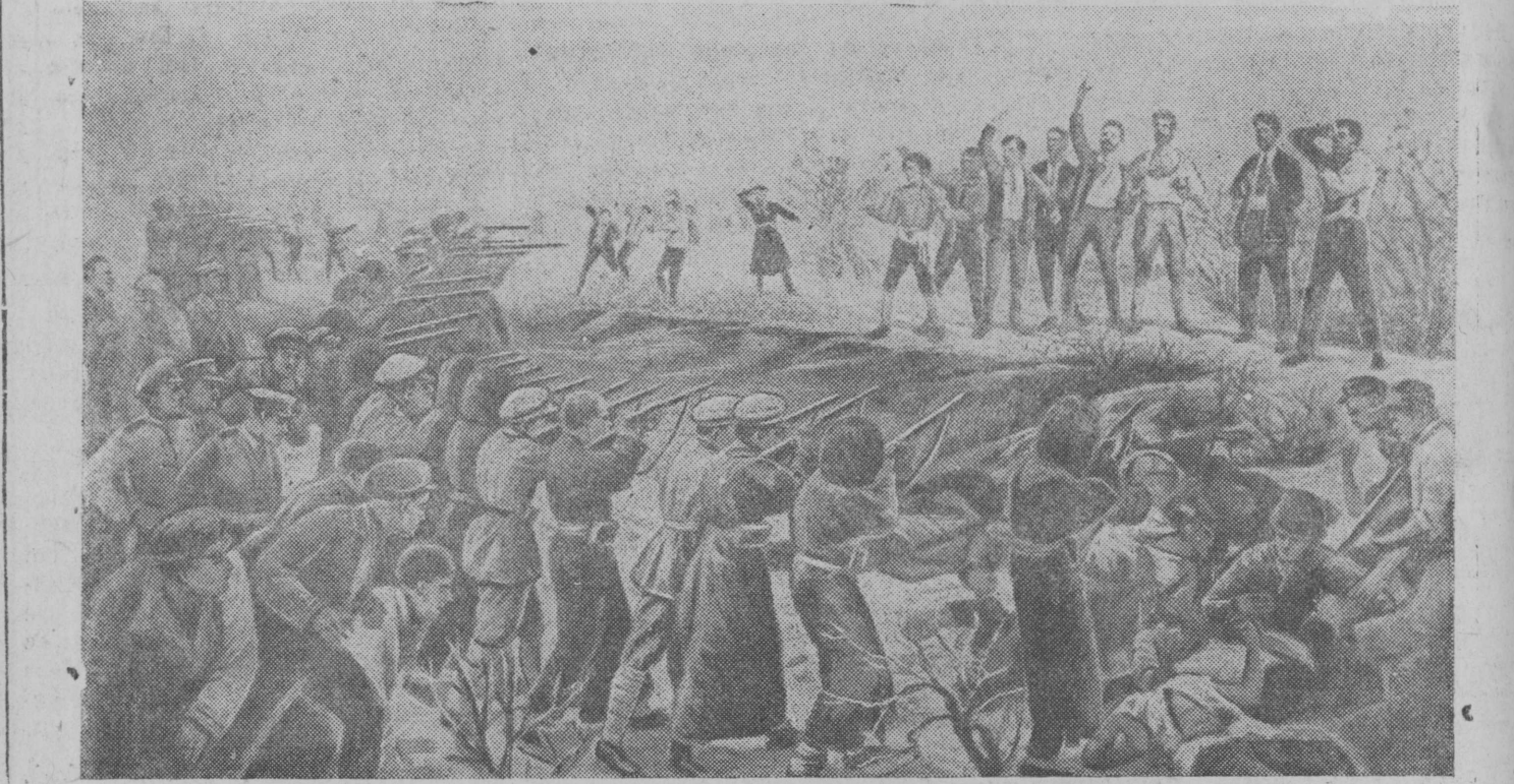
20 сентября 1938 г. исполняется 20 лет со дня расстрела английскими интервентами и эсерами двадцати шести бакинских комиссаров. НА СНИМКЕ: Расстрел 26 бакинских комиссаров с картины художника Бродского. (СОЮЗФОТО).

В марте 1918 года силы Бакинского Совета разгромили контрреволюционных мусаватистов в Баку. Вся полнота власти перешла в руки Советов. Был создан Совет народных комиссаров под главенством Шаумяна. Джапаридзе был назначен наркомвнутром и наркомпродом, Фиолетов — председателем Бакинского Совета народного хозяйства, Мешади Азизбеков — руководителем азербайджанского пролетариата и крестьянства — был назначен губернским комиссаром, на него была возложена от-