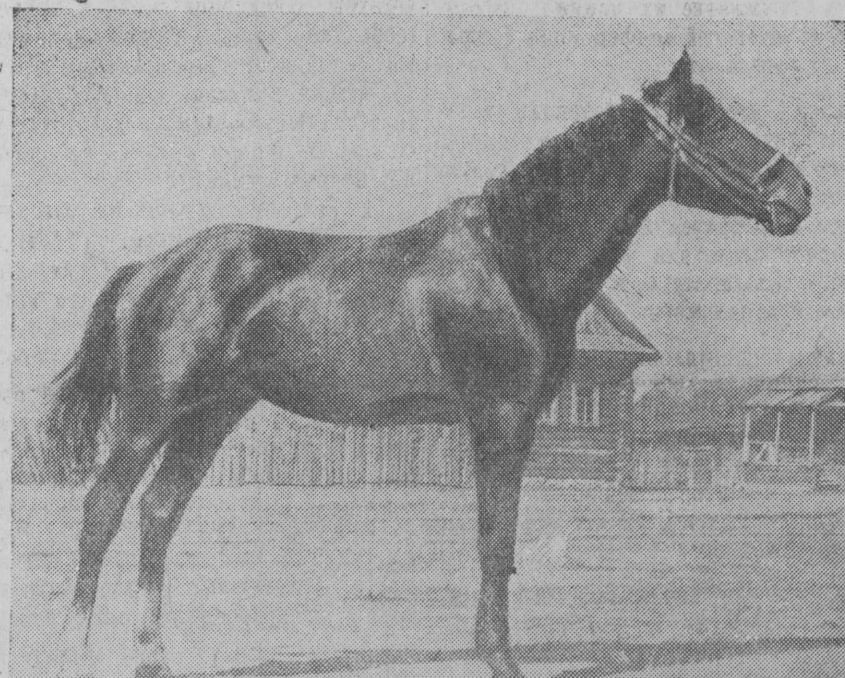
Колхоз «Твердая дружба» Максатихинского района организовался в 1929 году. За это время колхоз вырос и окреп. Сейчас он имеет 54 лошади, 115 коров, много свиней и овец. Кроме того у каждого члена колхоза есть корова и другой скот. НА СНИМКЕ: племенной производитель жеребца по кличке «Чиж». Его цена равняется цене полугорюхой автомашины. На днях колхоз продает этого жеребца в племенную ферму и по наряду покупает автомашину.