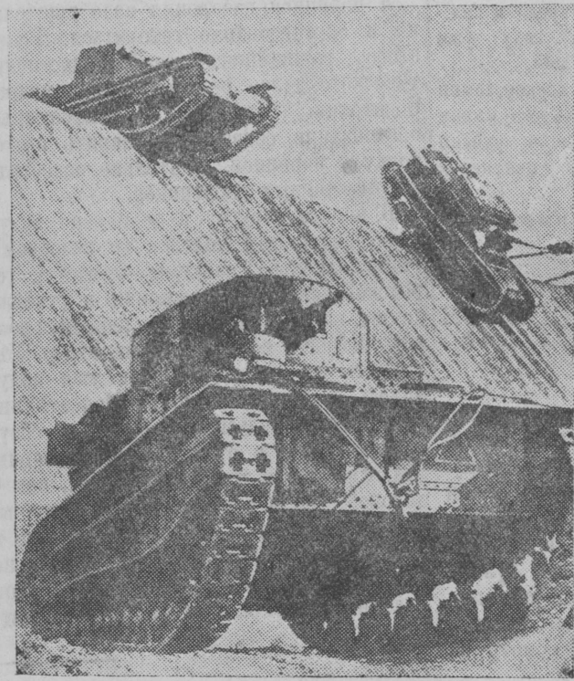
Маневры чехословацкой армии. НА СНИМКЕ: танки на маневрах.

ЛОНДОН, 25 сентября. Как сообщает берлинский корреспондент агентства Рейтер, после приказа чехословацкого правительства о всеобщей мобилизации курс акций на берлинской бирже упал на 5 пунктов.