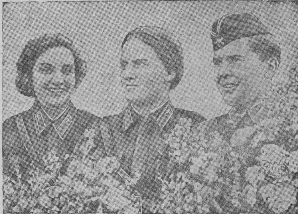
В. С. Гризодубова, М. М. Раскова, П. Д. Осипенко.

Митинг, посвященный встрече героического экипажа самолета «Родина» открывает начальник военно-воздушных сил РККА командир второго ранга тов. Локтионов. От имени правительственной комиссии по перелету и военно-воздушных сил РККА он передает героическим летчицам пламенный привет и поздравляет их с замечательным успехом, с установлением нового международного женского рекорда.