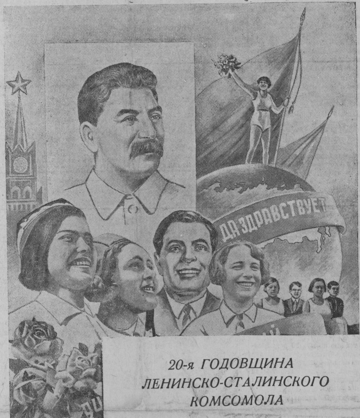
20-я ГОДОВЩИНА ЛЕНИНСКО-СТАЛИНСКОГО КОМСОМОЛА

агрессором, которая проводится в настоящее время некоторыми демократическими странами Европы. Действительный мир может быть обеспечен лишь в том случае, если все страны, заинтересованные в сохранении мира, решительно выступят против фашистской агрессии. Основным условием сохранения всеобщего мира, говорится в обращении, является тесное сотрудничество Англии, Франции и СССР.