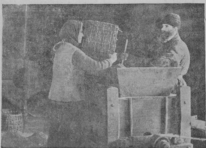
В колхозе имени Сталина (Лихославльский район) 50 гектаров было засеяно семенниками клевера. В нынешнем году колхоз досрочно сдал государству 39 центнеров 61 килограмм семян...