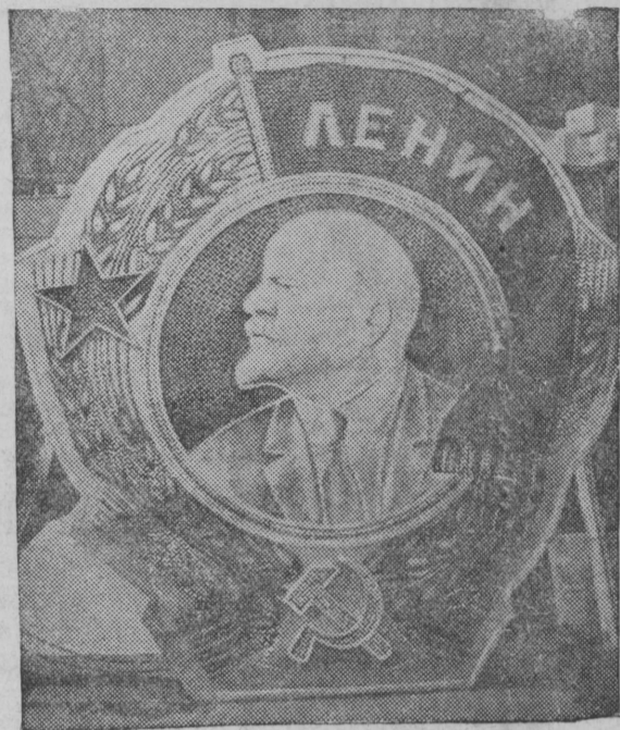
В XXI годовщину Великой Октябрьской Социалистической революции свето-мозаичная мастерская Всесоюзного художника закончила изготовление монументальных изображений из светящихся камней орденов: Ленина, Красного Знамени и Трудового Красного Знамени.

ЛОНДОН, 25 ноября. Английские газеты сообщают о концентрации крупных польских войск на чехословацкой границе. Так, по словам дипломатического обозревателя газеты «Ивнинг стандарт», вдоль границы Закарпатской Украины Польша сосредоточила семь дивизий своих войск.