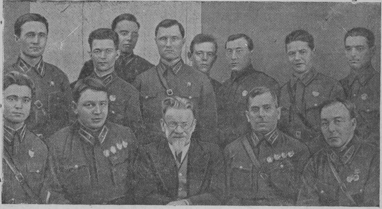
27 ноября в Кремле на заседании Президиума Верховного Совета СССР Председатель Президиума Верховного Совета СССР М. И. Калинин вручил ордена Советского Союза Героям Советского Союза П. В. Рычагову, Ф. П. Полынину, А. С. Благовещенскому, участникам боев в районе озера Хасан и другим.

Во многих пехах Кировского завода в обеденный перерыв были проведены траурные митинги. С воспоминаниями о Кирове выступили старые производственники, инженерно-технические работники.