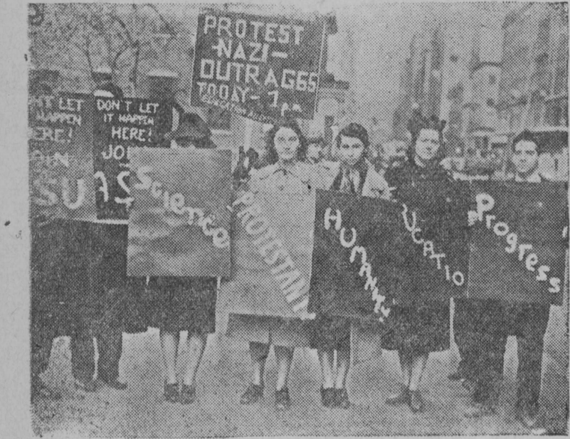
Во всех странах происходит демонстрация протеста против зверских расправ с еврейским населением в фашистской Германии.

нельзя говорить о неизменной тридцатилетней практике, — наоборот, эта практика на протяжении этого времени менялась. Если изменения могла предлагать Япония, то почему не вправе это делать СССР?