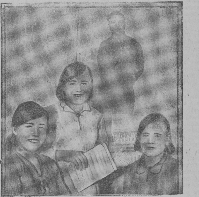
При трофимковской избе-читальне, Новокарельского района, работает хоровой кружок, состоящий из колхозников и работников трофимковской отделения васьильской трикотажной артели. Хор исполняет много русских, карельских и украинских песен.

Германии, действовавшее в 1938 году советско-германское соглашение о торговом и платежном обороте продлено на 1939 год.