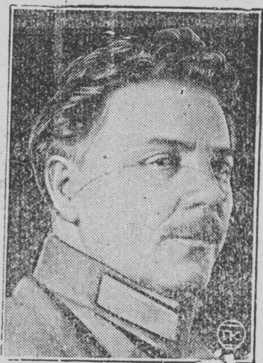
ВОРОШИЛОВ Кл. Иэфр.

Тэнэ, февраль 5-ын, Вырсы пәшә халык Комиссар Воршилов тәнг шачмылан 50 и шон.