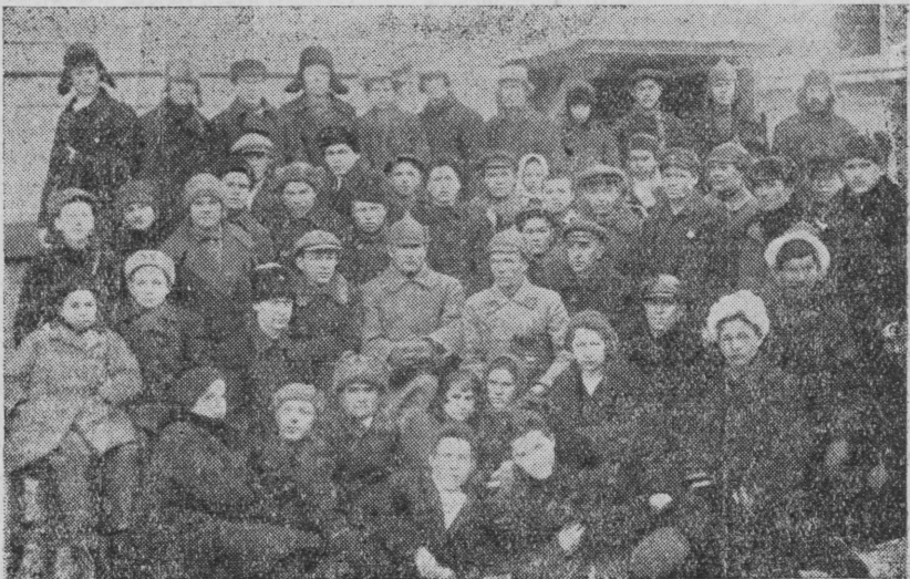
Труйышы халык иктй дәнбйнок Осовиахим ушэм чльәнэш пыры Снымкыштй: Эртйш 1930 ия Цик кангонйш- тйшй Осоавиахим конференцин дьелегатвлә