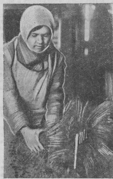
Vallitah pelvašta sortuloida myötj