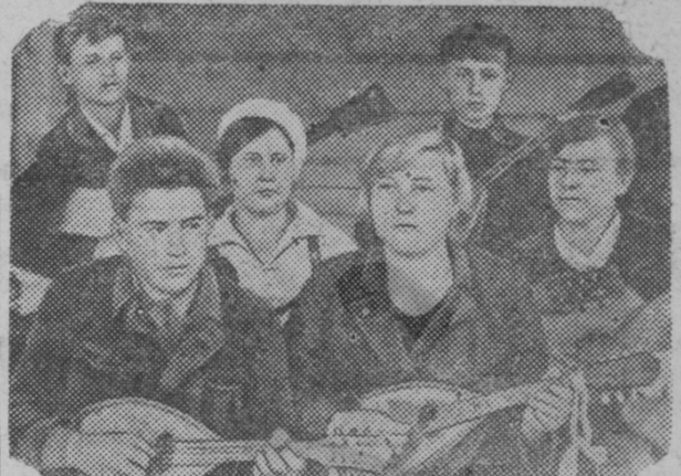
Illoilla, konza on jovu aigane studentat mändih toko klubvah. Kaiken muozis-sa kruzikissa: dramatickoissa, soittamah opaşunda, fizikulturnoissa, şahmatno—şasecnoissa, studentat ruadostinke ruatah jogašne šidä otraslie myötj, kumbazeh heilä on himo i radenie. Rbgeneh luadie-cetih omilla vägilöillä vecerat i projittih hyö ylen veşšälädi. Spektakljain jälgeh nagole ollah tančinnat, soittav oma strunoi orkestra. Kruzkan rukovoditelja studenta Şarov N. mahto vedä ruadoh kaikki studentat, ken şuaccov muzikua. Strunoi orkestra soittē na slavul