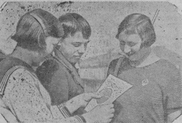
Peduciljšcan parahat opaştuvskoit strellat—otlicnikat Dridilov I. i Nikolaieva M.