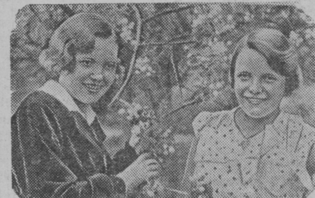
Hyvä on vñhodnoina päivänä lebiäceldiä linnan savuşsa. Tiälä on äijä zelenästä kazvandua i kukkual Rbgeneh tänne tullah uciljšcan studentat, štošb kizualdua ucile-bolan, ra, uciljšca, zanmaiccieceldua. Ruadostno i veşšellä on studentkoilla Borokovalla Manjalla i Titovalla Manjalla. Da kuin ei i ruaducicete näillä zaduşevnoi-loilla rişcikoloilla! Tällä vuvvella hyö loppietih opaşunnan peduciljšcaşsa. Nyt jo hyö eruidih kaikkih randoih. Uksi heištä rubiev karieloin školaşsa opaştamah lapsie, a toine varuštamah lapsie školoh postupin-dah varoin. Hyö möien opaşunnaşsa ol-lah otlicnicat. Mintän ze ei ruaducicete, konza kaikki mändv nain hyviin!