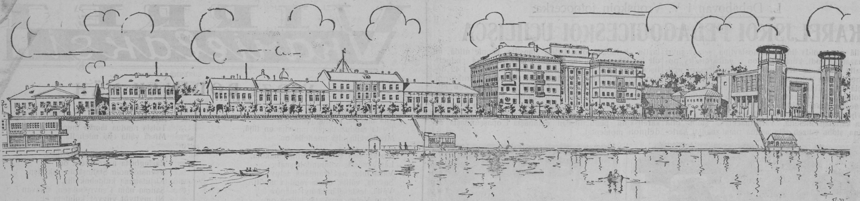
Гор. КАЛИНИН. НА НАБЕРЕЖНОЙ РЕКИ ВОЛГИ. (Зарисовка Благовещенского).