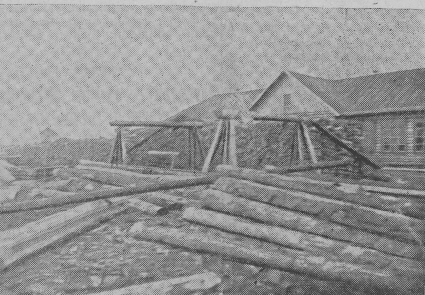
Вид на новую школу в Толмачах.