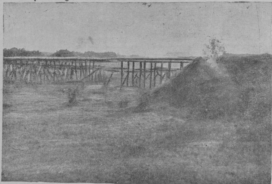
Строющийся мост через реку Медведица (Новокарельский район).