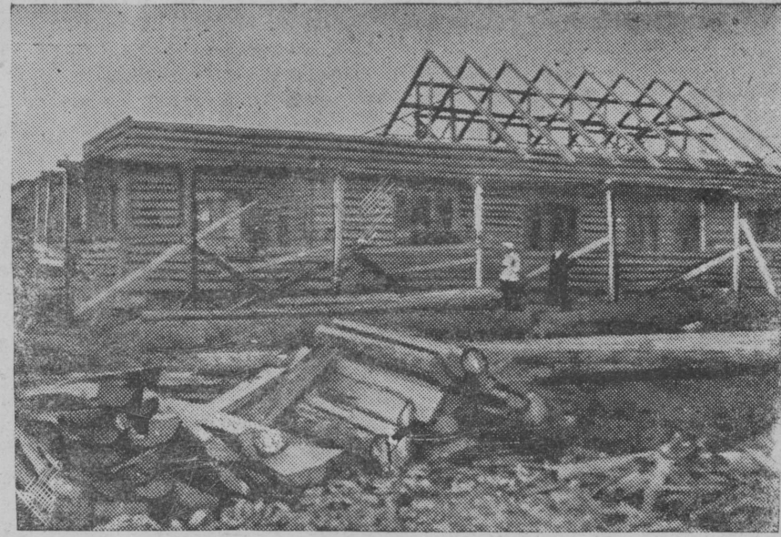
Строительство детских ясель в райцентре. (Новокарельский район).