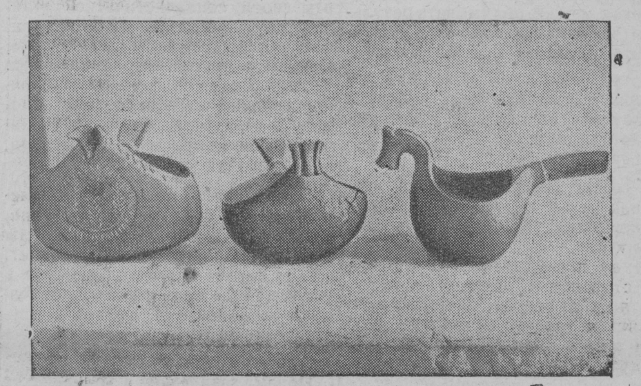
A tällā snimkazella neze puvhiezet aštbet—kavhat no hyō ollah resunkazinke i luajittu šelgiemmā.

Lihoslavljašsa, nygyzešsa Karelj-skoin okrugan centrāšsa, on karelj-skoi krajevedceskoi muzei. Hiān jo moni vuotta ruadav ših varoin, štošb kerātā mi voit enāmbi kaiken muos-tja predmetua i dokumentua, štošb konza tulet muzeih, voicczit lövdjā tādā zenmuozet predmetat: kirjutuk-šet, kolekciit, kumbazet annettaiš nāhā heissā ammuzeh i nygyzeh aigah nāh, kuin ellettih rahvaš iellā, kuin hyō borcuidih vorogoinke. Muzein vuoh myō niinze voicemma tiijūštua ših nāh, mistā i konza tuli nāh rāndoih kariella, kuin niān eli iellā i kuin nyt elāv Muzei kerāi karielazista raionois-ta vāgt āijān eksponattua. Myō tāmā piānā muduanzie ozutamma gazie-tašsa. Ka enzimāne resunkane: kolhana pavarca, kappane i toizet. Hiān resun-kazie myōtj myō niāmmā mytš olī karielalla aštbe ammuin, ammuin šillā aigua—šadua kakši-kolme vuotta tagah. A ka toine risunkane. Tāššā jo on paremmin holiutuot kavhat. Adrāt, puvhiezet aštovat, stuavat, kesselit, krassikot, svitcat i āijāt toizie eksponatoida šanotah iellā oluoh elāndāh i ruadoh nāh. Toizeh kerdah, myō hyväzestē i pitemmādi ozutam-ma muzein i nāhen zaduacat nyt, konza luadieci kareljskoi okrugā.