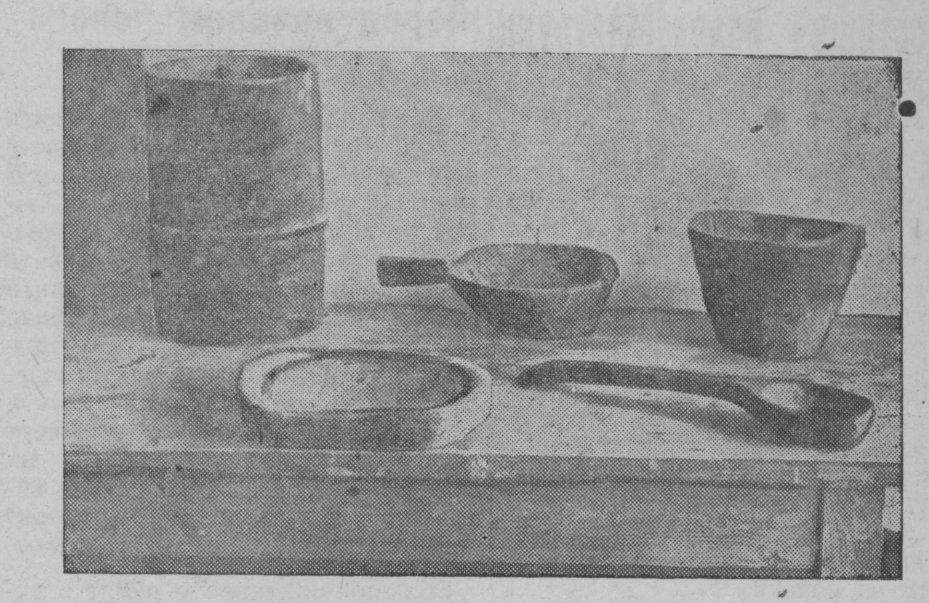
Lihoslavljan muzein eksponatoista. Snimkalla: iinigāzet aštbet kum-bazet oldih karielalla: kolhana, luzikka, kavhane i padane.