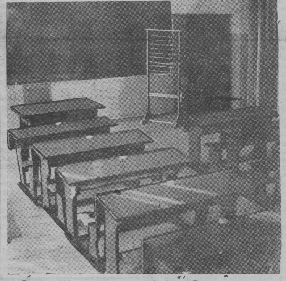
Вновь отремонтированный класс в школе № 7 к/новому учебному году. (Лихославль).