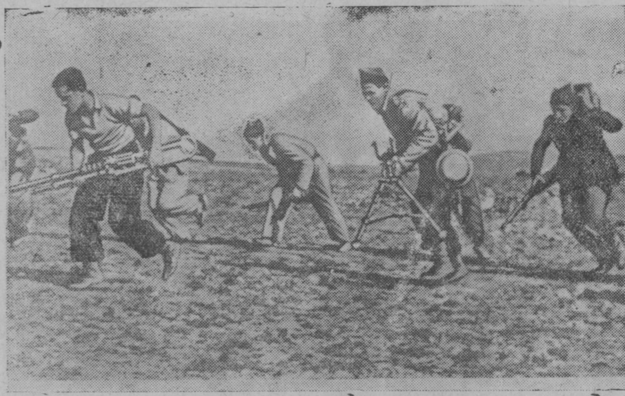
НА СНИМКЕ: Группа республиканских пулеметчиков занимает новые позиции, оставленные фашистами (Центральный фронт).

От РЕДАКЦИИ. Редакция обращает внимание лихославского райкома партии на изложенные факты в письме тов. Смирновой, говорящие о нечутком отношении к стахановцам и надеется, что по ним будут приняты соответствующие меры.