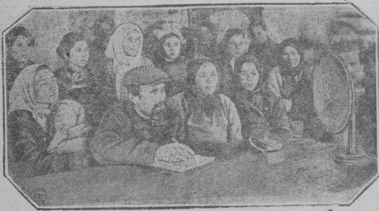
НА СНИМКЕ: колхозники коммуны „Серп и Молот“ Сумского округа слушают по радио лекцию о сельском хозяйстве и о проведении весеннего сева.