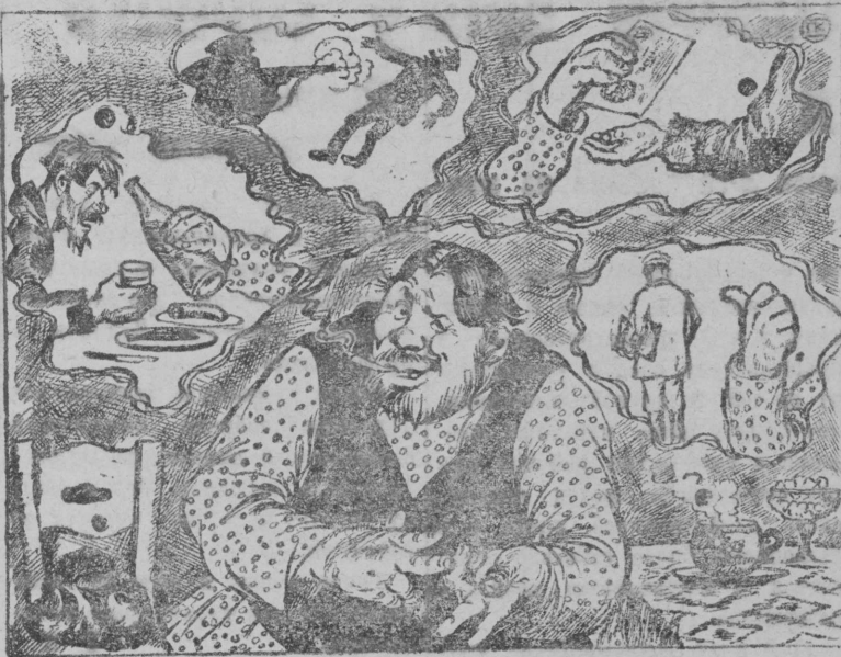
Наша очередная задача: ликвидировать кулачество, как класс

Болтовня о классовой борьбе, писки и визг насчет классовой борьбы в колхозах представляют теперь характерную черту всех наших „левых“ крикунов. Причем наиболее комичным (смешным) в этом писке является то, что пискуны эти „видят“ классовую борьбу там, где ее почти нет, но не видят ее там, где она существует и переливается через край. (Есть ли элементы (части, случаи) классовой борьбы в колхозах? Да, есть. Не может не быть элементов классовой борьбы в колхозах, если там еще сохраняются пережитки индивидуалистической и даже кулацкой психологии, если там имеется еще некоторое неравенство. Можно ли сказать, что классовая борьба в колхозах равноправна классовой борьбе вне колхозов? Нет, нельзя. В том-то и состоит ошибка наших „левых“ фразеров (говорунов), что они не видят этой разницы. Что значит классовая борьба вне колхозов, до образования колхозов? Это значит—борьба за кулаком, владеющим орудиями и средствами производства и закабаляющим себе бедноту при помощи этих орудий и средств производства. Эта борьба представляет борьбу не на жизнь, а на смерть. А что значит классовая борьба на базе колхозов? Это значит, прежде всего, что кулак разбит и лишен орудий и средств производства.