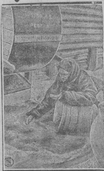
На СНИМКЕ: Сортировка семян в дер. Добнино Брянск.

Семена на 100% должны быть отсортированы