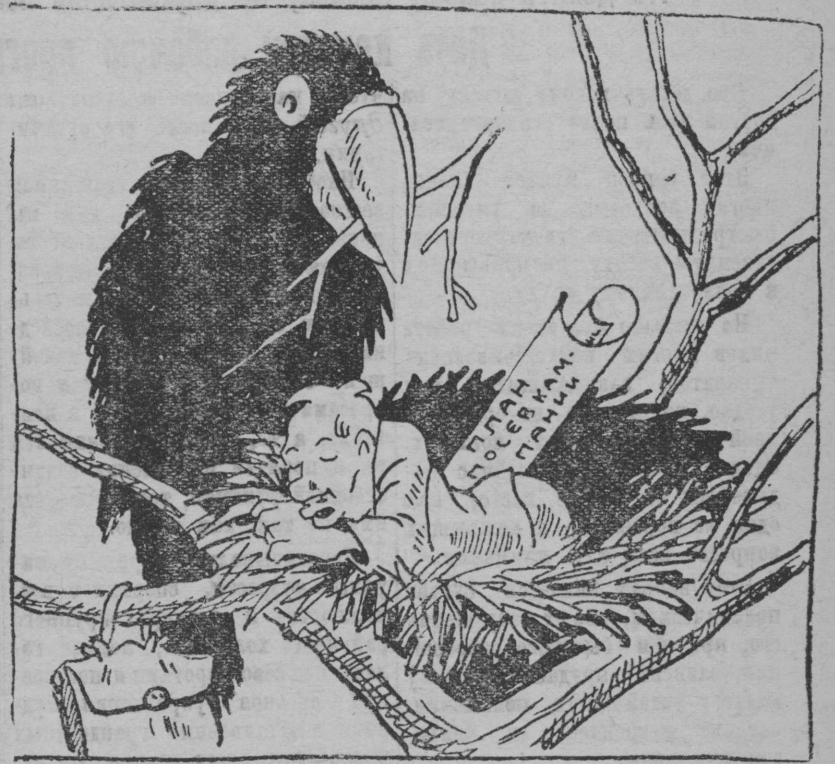
Ждут прилета грачей

А как участвуют другие Шам и культурно-просв. организации округа в этой важнейшей, решающей хозяйственно-политической кампании? Н. Попов