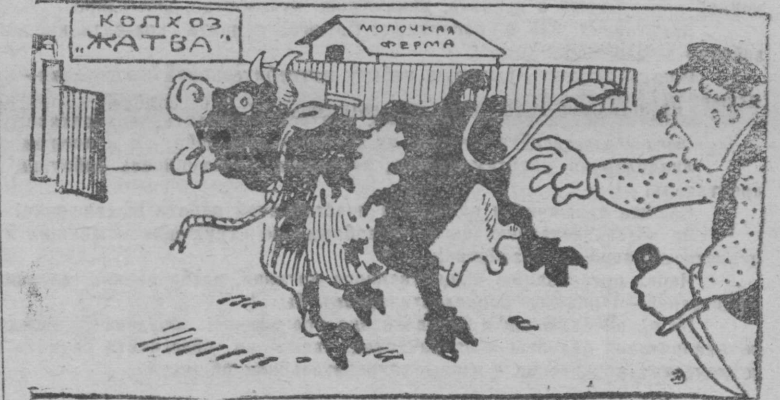
Из-под кулацкого ножа—в колхозный двор