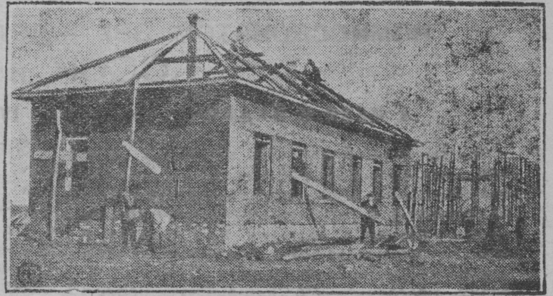
На СНИМКЕ: Постройка саманных домов в колхозе им. т. Дзержинского (Ульяновск. окр., Св. Волга).

злостно сократившим посевную площадь обложение по семенной площади по закону будет производиться по данным учета на 1930 г., а по данным 1929 г. как мера борьбы с злостным сокращением посевов.