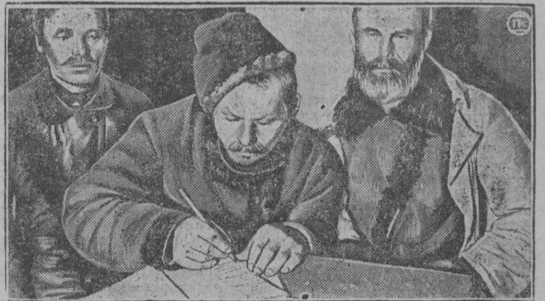
На СНИМКЕ: момент подписания договора представителями колхоза и единоличников.