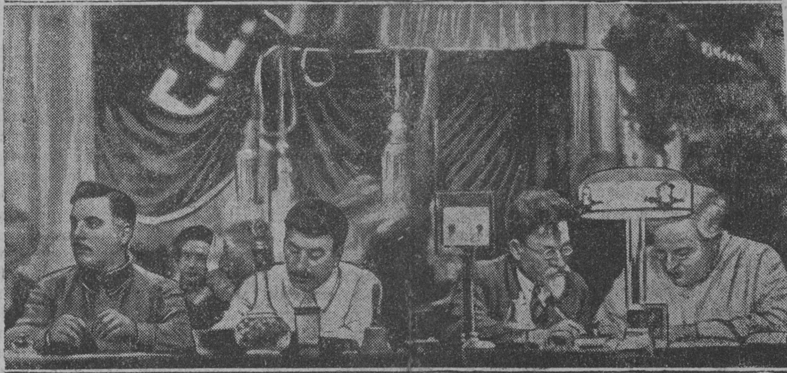
26-VI в Москве в здании Большого театра открылся XVI партс'езд. НА СНИМКЕ: В Президиуме с'езда. Слева направо: тов. Ворошилов, т. Сталин, т. Калинин и т. Енукидзе.

„В период наступления социализма на капиталистические элементы правый уклон остается главной опасностью в партии“.