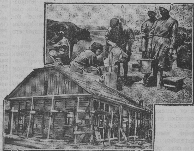
В расположенной близ Астрахани молочной совхозе в настоящее время идет усиленная стройка двух скотных дворов на 200 голов каждый и телятников на 100 голов.

На снимке: Сверху—приемка молока, внизу—строительство телятника.