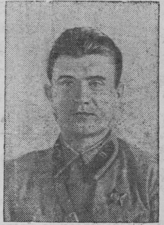
К годовщине разгрома провокаторов войны—японских самураев—в районе озера Хасан.

Так закончился первый бой в районе озера Хасан.