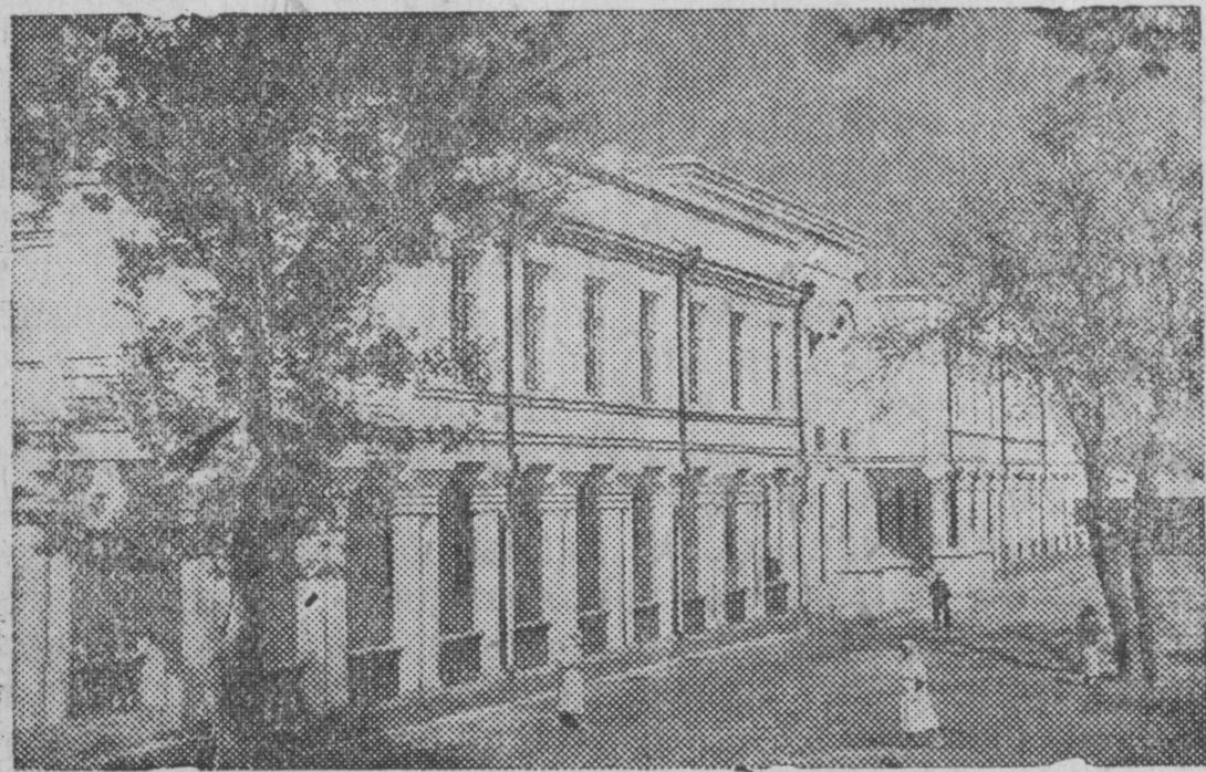
На снимке: Здание нового клинического санатория в Цхалтубо (Грузинская ССР).