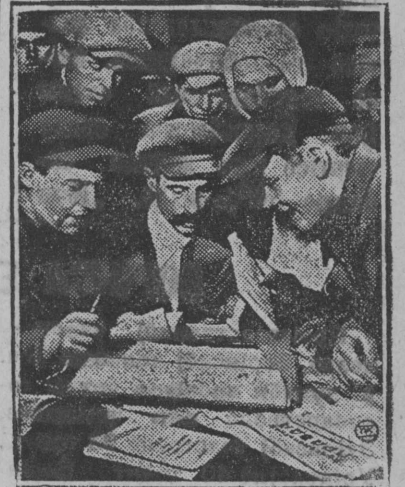
На снимке: Колхозники колхоза „Пламя факела“, подавшие заявления о вступлении в партию.