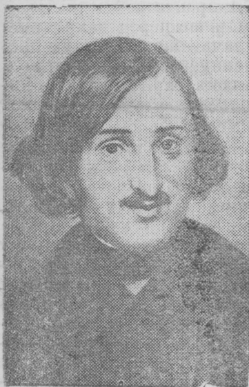
На снимке: Н. В. Гоголь.

К 130-летию со дня рождения великого русского писателя Николая Васильевича Гоголя.