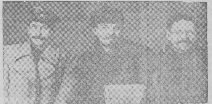
На снимке: И. В. Сталин, В. И. Ленин и М. И. Калинин на VIII съезде РКП(б). (Март 1919 г.).

К 20-летию со дня открытия VIII съезда РКП(б).