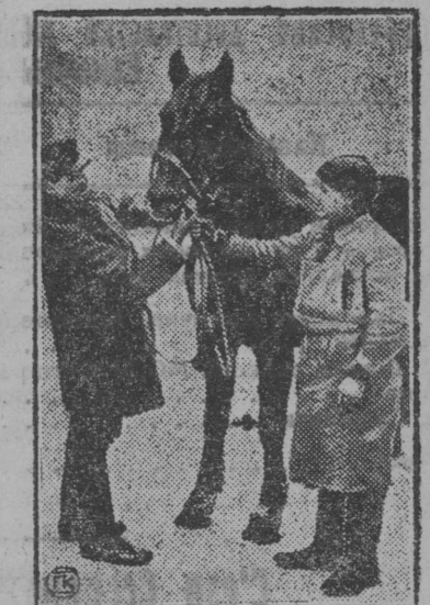
Животноводсоюз Сев. Зап. Области снабжает в весеннему севу бедноту и колхозы несколькими тысячами лошадей в кредит.

НА СНИМКЕ: крестьянин осматривает покупаемую лошадь в главной конной базе животноводсоюза.