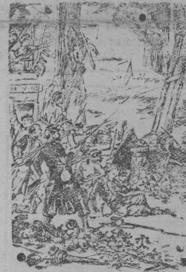
Снимок с редкой гравюры 71-го года. Национальные гвардейцы на баррикаде 25-го мая 1871 г.