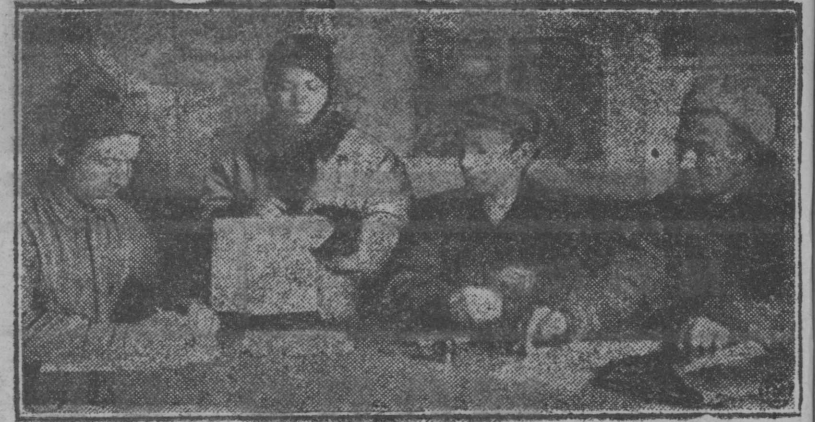
Общественној инкаэз: бөріјёмаэ председателё сельсоветэ.

Пятое—заработную плату батрак получает не реже раза в месяц. Таковы основные требования закона. Договаривающиеся стороны должны их не только принять, но и выполнить. Для батрака проку получить мало, если условия его труда окажутся удовлетворительными только на бумаге. Советов, зарегистрировав договор, должен посмотреть и за тем, как он проводится в жизнь. Батраки при нарушении договора в свою очередь должны обращаться за помощью в сельсовет или профсоюз. Те их, без сомнения, поддержат.