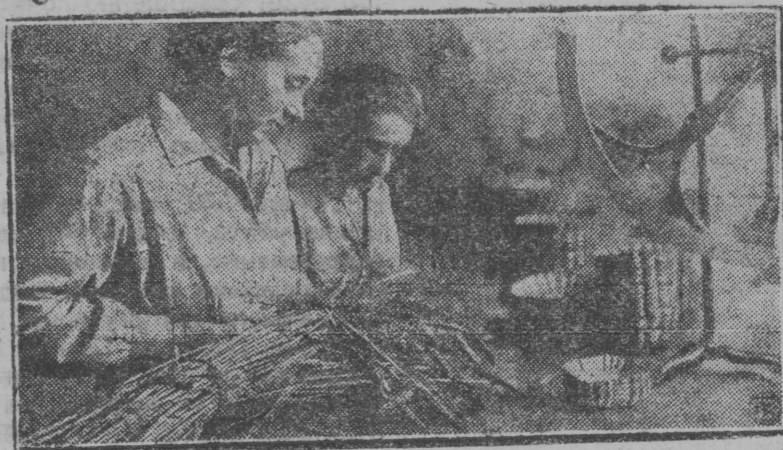
Инкаэз машинайн ьарјалбны лон.