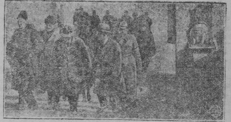
НА СНИМКЕ: члены делегации на лестнице Грановитой палаты в Кремле.