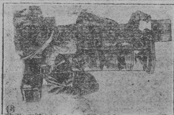
Сортируйтны кызыс су трижерн.

Велвинской сельсов., Кудымкар. р. страксемпонд öktisö 78 тсенть. — быдöс мунда колис. Членской взносез сельковö быдöс 7 тсенть. да öмön 207 руб.